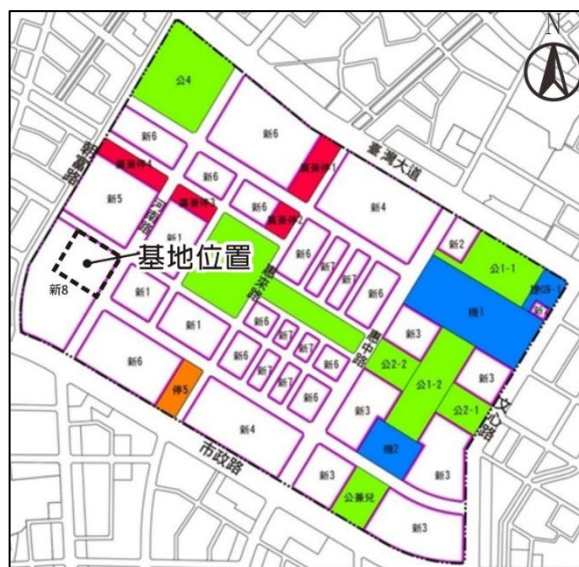
圖二 土地使用分區圖